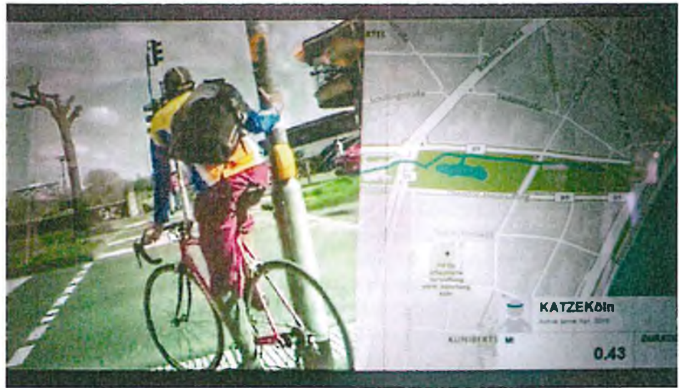
Abb. 5 Das Kölner Radfahrteam mit den am Fahrrad befestigten Geräten – mehr braucht es nicht für eine Live-Übertragung nach Nairobi, lediglich ein zusätzliches Laptop!